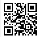
メール申込用 二次元コード