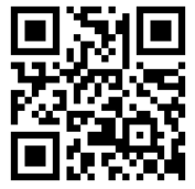
メール申込用 二次元コード

右記の二次元コードを読み取ると、メール作成画面が表示されます。本文に必要事項を入力し、送信してください。二次元コードが読み取れない場合は、メールの件名に「第67期豊栄総合体育館テニス教室」と入力し、本文に必要事項を記入の上、 tennis@hapisuka.com 宛に送信してください。