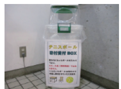
回収ボックス(窓口脇)