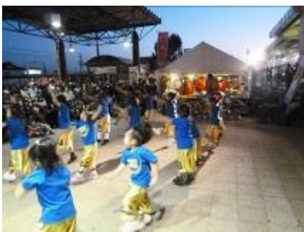
ヒップホップダンス

最近、ダンスチームのイベントへの出演依頼が多くなっています。イベントが多い時期ということもありますが、特に10月11月は多くの場所でダンスを披露する機会を頂きました。このような、日頃の練習の成果を披露する場は、参加している子供たちにとって、ドキドキやワクワクを体験できる貴重な機会になっていると思います。これからもハピスカダンスチームをよろしくお願いします。